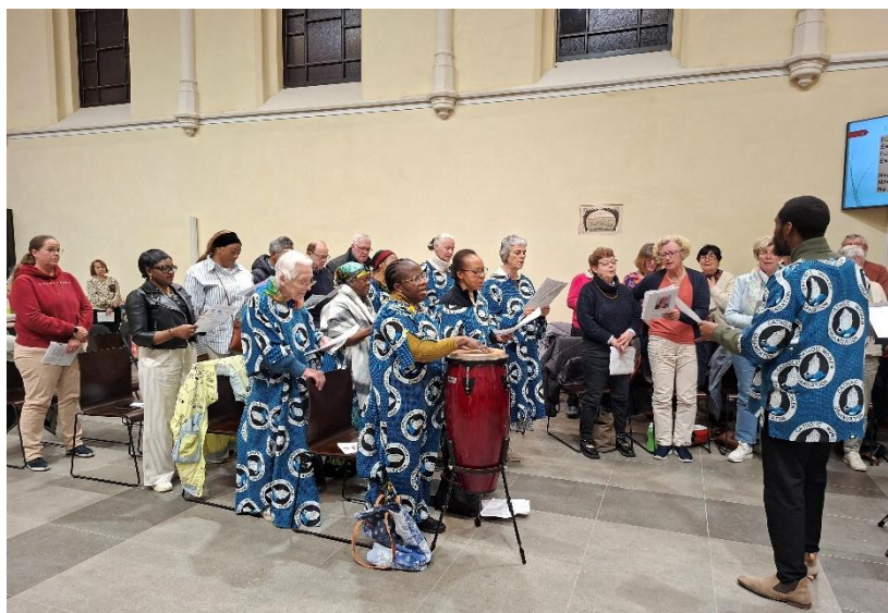
Matondo tijdens WGD 2026 - Engelse kerk

Multiculturele rooms-katholieke viering in de Hazegraskerk Elke tweede zaterdag van de maand om 18:15 uur in de Hazegraskerk Met medewerking van het koor Matondo