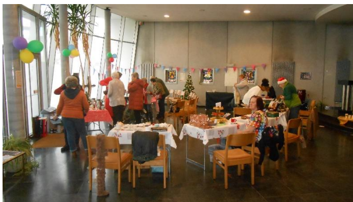
Kerstmarktje tijdens koffiebabbel

Pionier in Oostende – zoals bekend is er begin oktober 2023 een werving gestart voor een pionier die het pionierswerk in de protestantse kerk van Oostende kan verderzetten . De uiterste datum waarvoor een kandidaatstelling zou moeten worden ingediend, was 30 november jl. Er heeft echter niemand gereageerd. Dinsdag 9 januari komen we samen met de reflectiegroep om af te spreken hoe we de vacature opnieuw onder de aandacht kunnen brengen.