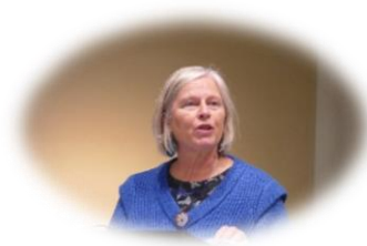
Hanneke van de Evangelische kerk