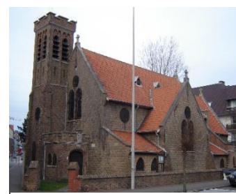
St George - Anglicaanse kerk Knokke

Zie ook: www.spreaker.com/show/koinonia-live