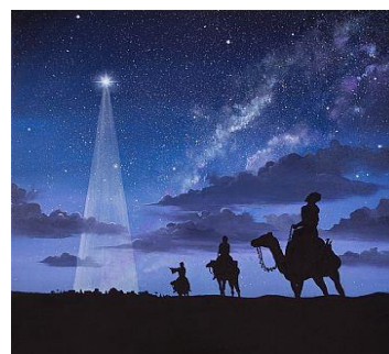
Figuur 1 Deel het Licht

Deze viering wordt gehouden in de week van gebed voor de eenheid onder christenen. Welkom! Het is gelijk een kans om de gerenoveerde Engelse kerk te bewonderen.