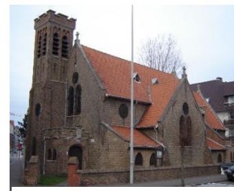
St George - Anglicaanse kerk Knokke