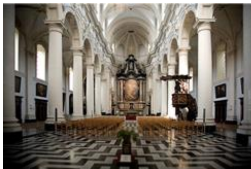
Interieur Walburgakerk Brugge